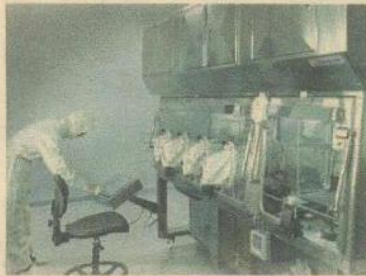
Msti, isolatore per test di sterilità

Obiettivo di Comecer è il rispetto dei fondamentali requisiti di sicurezza e qualità, non solo internamente ma soprattutto verso il cliente finale.