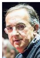
Sergio Marchionne ad of Fca

Con una lettera inviata a Emma Marcegaglia, allora presidente, nell'estate 2011 Sergio Marchionne annunciò che la Fiat, ancora lontana dalla fusione con Chrysler (sarà ufficializzata il 12 ottobre 2014), sarebbe uscita da Confindustria a partire dal 1° gennaio del 2012. Una decisione maturata ufficialmente a causa dell'intesa tra gli industriali e i sindacati che di fatto neutralizzava, a detta di Marchionne, le novità sulla contrattazione inserite dal Governo nell'ultima manovra finanziaria. Ma le ragioni dello strappo erano più profonde ancora: al momento della nascita di Fca il gruppo praticamente divenne non più italiano bensì anglo-olandese, e Marchionne accusò la Confindustria di essere rimasta legata a vecchi schemi "provinciali" e di non aver capito le grandi sfide della globalizzazione. L'effetto-Marchionne è ad ampio raggio: molti grandi gruppi sono da allora usciti da Confindustria, non a caso quelli con maggiore proiezione internazionale come Salini. Ma anche Cartiere Pigna, Nero Giardini, Gallozzi. Le ultime a uscire sono state 60 aziende nautiche, nel luglio scorso.