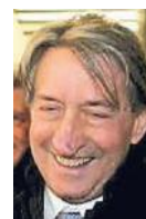
L'economista Innocenzo Cipolletta, a lungo direttore generale di Confindustria In alto, il convegno di Vicenza del 2006 con Silvio Berlusconi che attacca il Sole 24 Ore

la politica economica non passa più per le parti sociali».