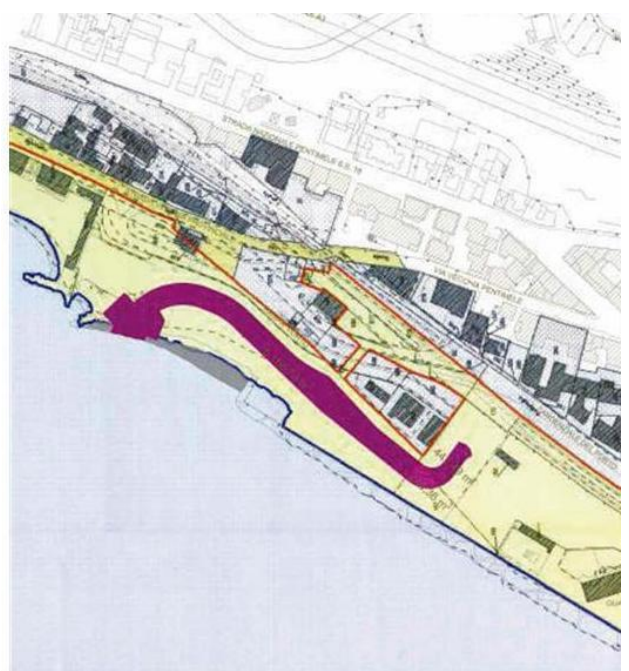
Devviare il traffico. Questa la missione voluta dalle aziende